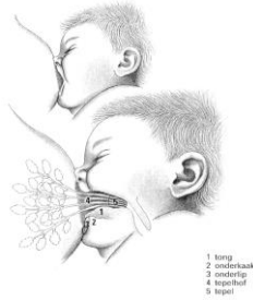
Arnet Mulder lactatiekundige IBCC